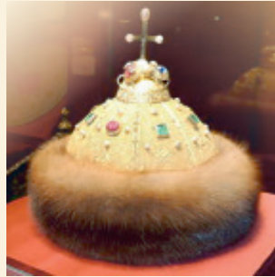
Русия тожи ("Мономах қалпоғи")