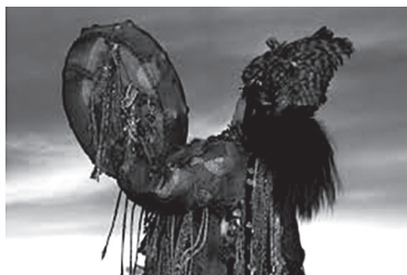
Эркак ва аёл шомон