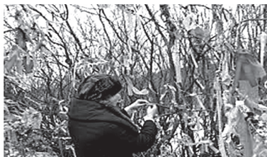
Қабрлар ва дарахтларга ялов бойлаш