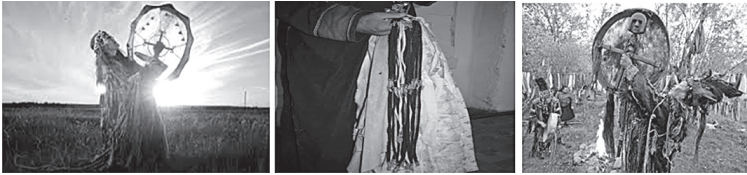
Шомоннинг худо Улкан билан мулоқоти ва маросим анжумлари

Диншунослик фанида шомонийликка алоҳида дин сифатида қаралади. Бироқ кўпгина туркий халқларда шомонийлик тангричилик динининг таркибий қисми сифатида кўринади. Шомонлар тангричилик динида илоҳий дунё ва илоҳий кучлар билан одамлар ўртасида воситачи ҳисобланади. Шунингдек, улар табиат ҳодисаларини башорат қилувчи, табиб, рухлар билан одамлар орасида воситачи, анъанавий маросимлар ташкилотчиси каби вазифаларни ўтаб келишган.