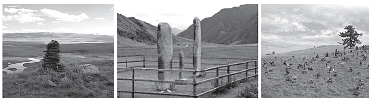
Бугунгача тангричилик динини сақлаб келаётганлар – олтойликлар қабрлари

Тангричилар ўликни ерга қабр қазиб анъанавий тарзда дафн қилишади. Шунингдек, ўлик билан бирга бир неча кунга етадиган озиқ-овқатлар, от уловлари, унинг идиш-товоқлари, қуроллари, аёлларга эса тикув, тўқув дастгоҳлари ва ашёларини қўшиб кўмиш одати ҳам машхур.